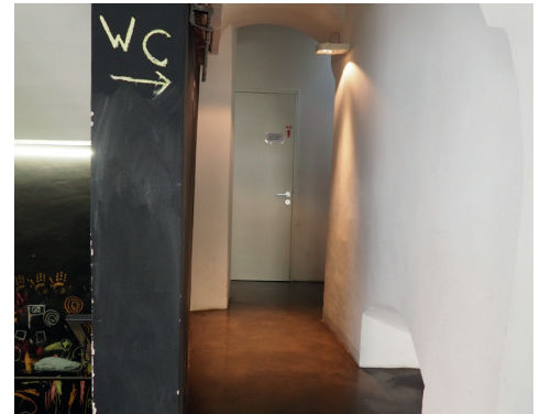
Weg zu Toilette