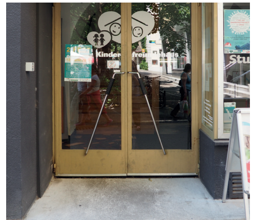
Eingang über Tummelplatz