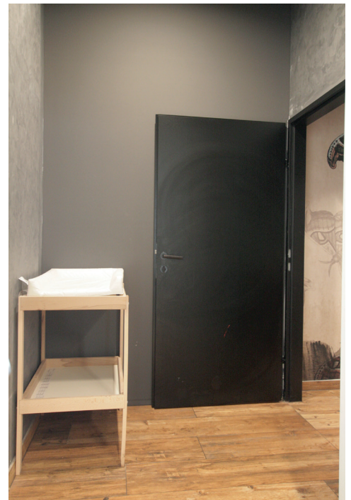
Vorraum barrierefreies WC