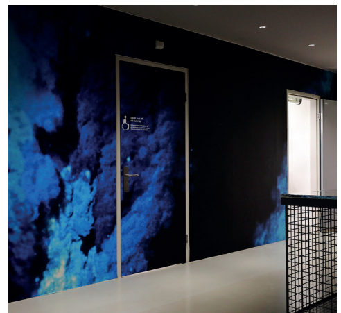
WC-Tür | Barrierefreies WC im UG