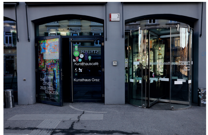
Eingang Kunsthaus Café