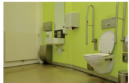
Barrierefreies WC 2. OG