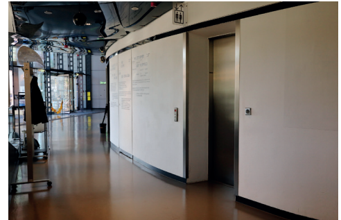
Lift in die Ausstellung