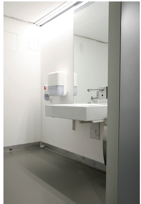
Barrierefreies WC im UG