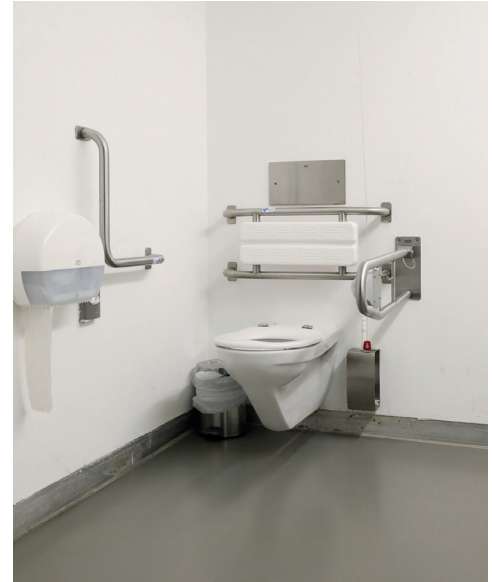
Barrierefreies WC im UG