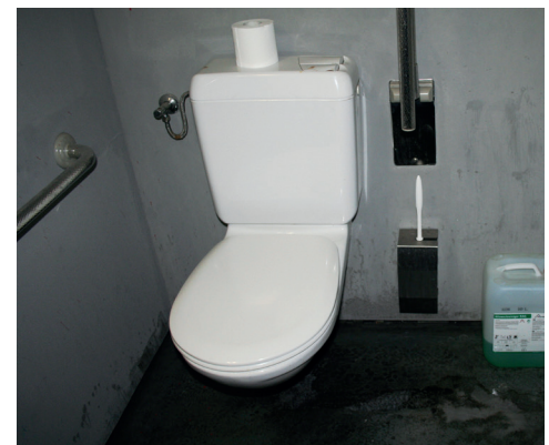
WC und Plan WC

Stand: April 2012, alle Angaben ohne Gewähr, Graz Tourismus in Zusammenarbeit mit der Behindertenselbsthilfegruppe Hartberg